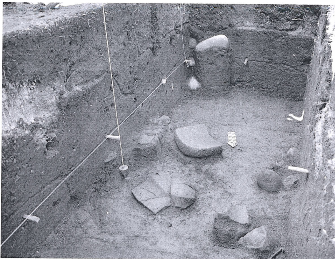
Figura 2. Fotografía del basurero cóncavo BB4b/6A (Parque Arqueológico Nacional Tak'alik Ab'aj, MICUDE, DGPCN/IDAEH 2019).